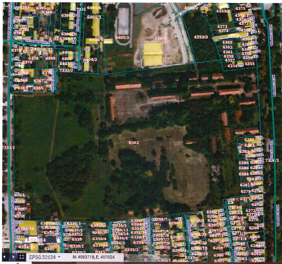
локација блока 3-9-7-стара касарна у Руми